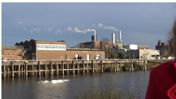
Screenshot uit video 2019-11-14 (2)

Klacht van Westervoortsedijk staat in het milieusinspectieformulier op 15 nov terwijl op de klacht 14 nov staat. Op 14 nov was de wind OZO (bron: KNMI) Je ziet de rook recht naar ons huis toewaaien in de video.