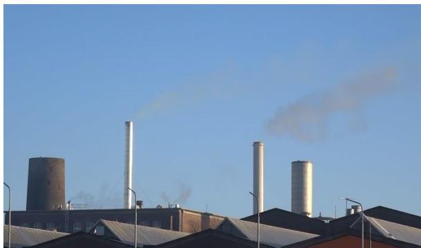
Screenshot uit video 2019-12-01 (1)

De ketel zou van 29 november tot 3 december uit hebben gestaan volgens het milieuinspectierapport. De video en het screenshot uit de video laten duidelijk zien dat er rook uit de ketel komt op 1 december. De ketel zou op dat moment volgens het rapport al minimaal 2 dagen uit moeten hebben gestaan.