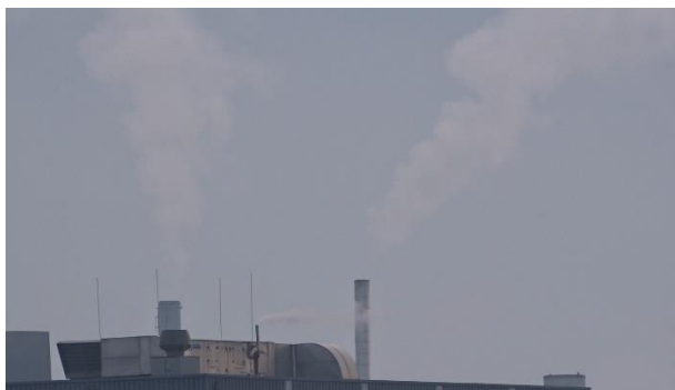
Screenshot uit video 2019-11-17 (2)

Geurklacht afkomstig uit de Kamillelaan (Malburgen). Wind overheersend uit NNW richting. Ketel 14 stond aan. Gezien windrichting niet de oorzaak, volgens het milieuinspectieformulier.