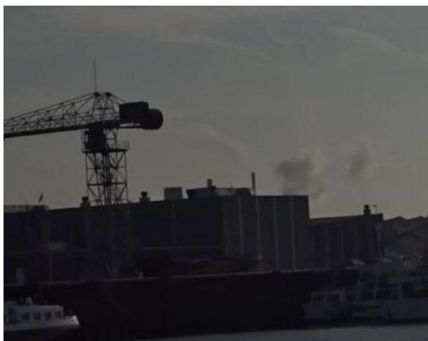
Screenshot uit video 2019-11-22